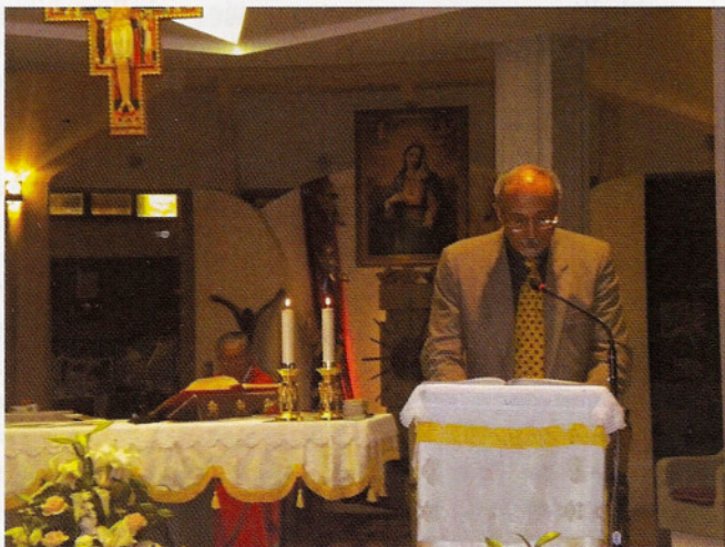
Le Letture durante la Santa Messa