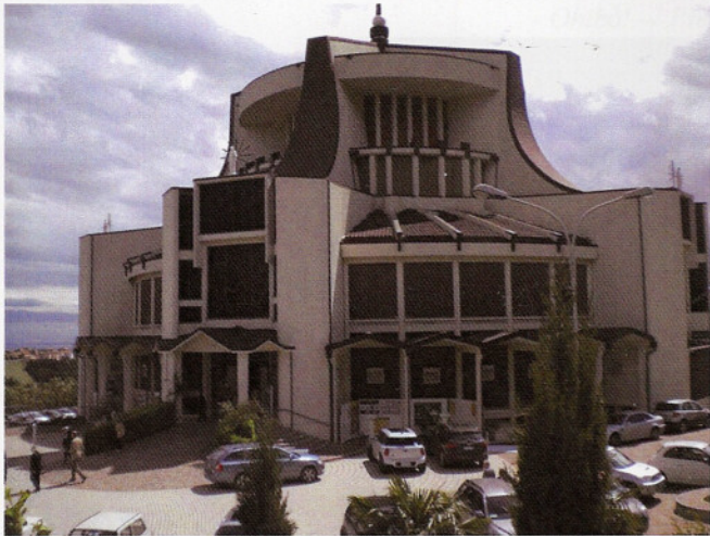
Santuario del Cuore Immacolato di Maria nella Curazia di Valdragone