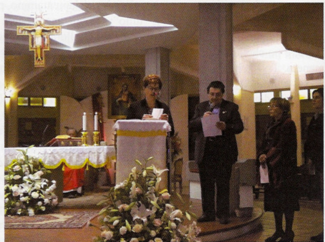
La Preghiera dei Fedeli recitata, nei rispettivi dialetti, dai Delegati Regionali