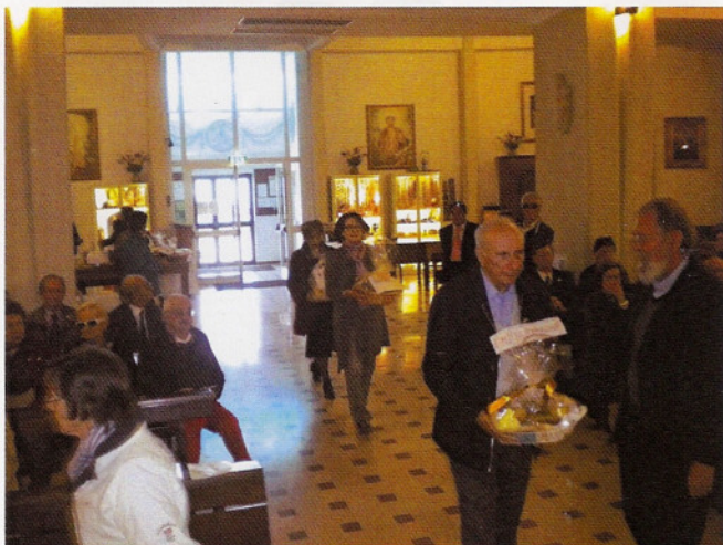
Offertorio: i Delegati Regionali portano all'altare i prodotti tipici della loro terra